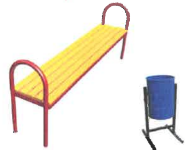
Скамья без спинки. дли. на:1500мм, ширина:400мм, высота:680мм. Урна металлическая. дли. на:620мм, ширина:330мм, высота:260