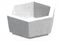
Цветочница бетонная. длина:880мм, ширина:770мм, высота:360мм.